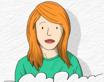
GIULIETTA LA PARTY-QUEEN